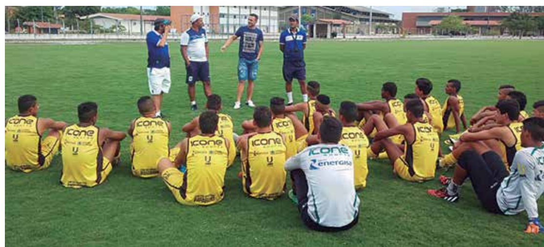
A garotada que fez boa campanha na Copa de Juniores terá vez no elenco principal do CSP

"Perdemos a vaga naquele jogo, onde poderíamos ter pelo menos empatado para decidir a sorte no último compromisso da fase. Valeu a pena e agora é pensar no Campeonato Paraibano e fazer uma boa campanha", observou o dirigente. (WS)