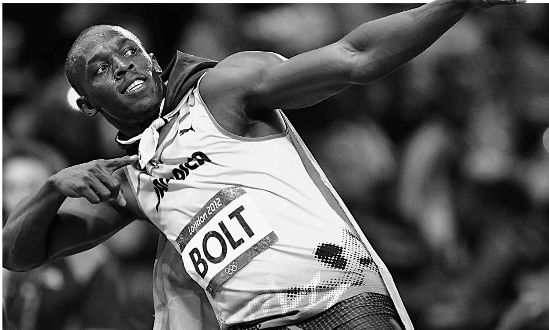
Usain Bolt comemora a sua vitória nos 200 metros no Mundial de 2015 e promete fechar a sua participação em Olimpíadas conquistando medalhas no Brasil

Desde os Jogos Olímpicos de Londres, quando foi medalha de bronze aos 20 anos, Lázaro Álvarez parece obstinado a conquistar o ouro. O cubano tem dominado todas as principais competições de boxe amador que disputou nos últimos três anos. Em 2015, o lutador