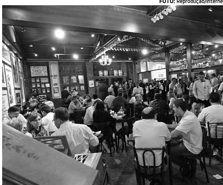
Consumação mínima fixada por bares e restaurantes é ilegal

E essas cobranças ilegais acontecem em várias relações de consumo. "Em nosso cotidiano somos cercados por cobranças indevidas que os bancos e institui-