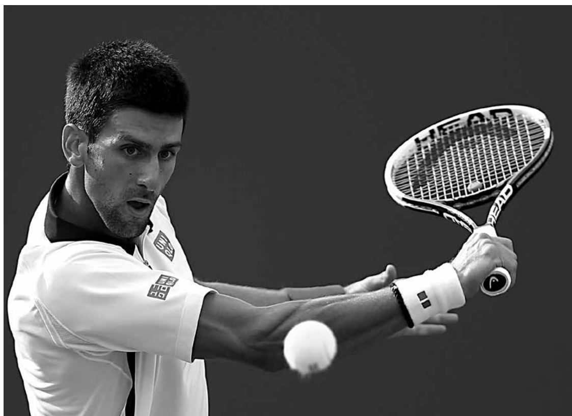
Novak Djokovic foi campeão do ATP Finals, encerrando 2015 com 11 títulos, sendo favorito no Brasil

Cada vez mais, a americana Adeline Gray vai se consolidando como a melhor do mundo na luta olímpica, categoria feminina até 75kg. Depois do título mundial em 2014, em Tashkent, ela repetiu a dose na atual temporada e manteve a hegemonia e o topo do ranking, levando a medalha de ouro em Las Vegas. Sem ainda ter disputado os Jogos Olímpicos, a jovem de 24 anos terá a primeira oportunidade no Rio, em 2016, e chega credenciada como favorita para subir ao lugar mais alto do pódio.