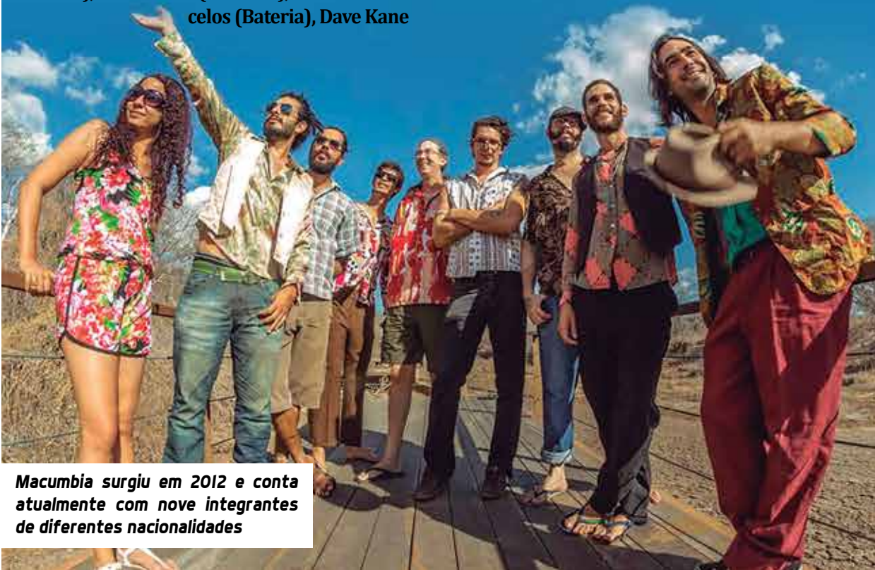
Macumbia surgiu em 2012 e conta atualmente com nove integrantes de diferentes nacionalidades

Quintas Tropicalientes faz parte da programação do Circuito Varadouro Cultural Verão 2016.