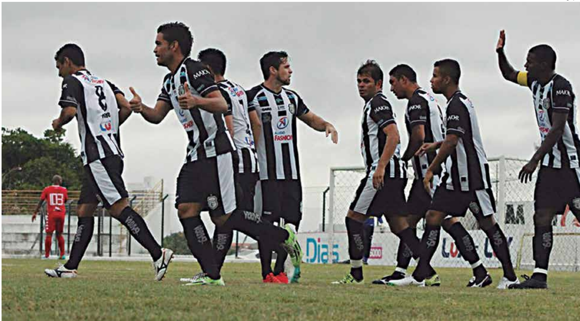
O novo elenco trezeano segue sua fase de preparação para o Estadual 2016 e, após vencer o América-RN no último sábado, joga hoje no PV contra o time do Potiguar

Segundo ele, chega para ajudar o Treze a ser campeão paraibano e fazer história no futebol da Paraíba. "Sou de ajudar e torcer pelo sucesso dos companheiros em qualquer situação. Claro que ninguém gosta de ficar na reserva, mas respeitarei sempre a opção do treinador", avaliou. Após encarar a equipe potiguar, o Galo da Borborema vai a Maceió-AL, no próximo