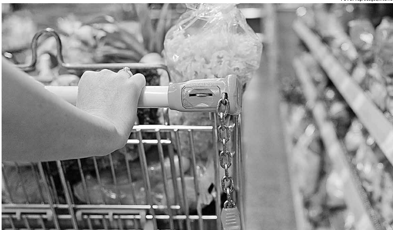
Alimentos apresentam a maior retração consecutiva na série sem ajuste sazonal nos últimos 12 anos desde os -11,3% de março de 2003

Volkswagen e GM aparecem em seguida, com recuos de 36,6% e 33,5%, respectivamente. Em dezembro de 2015, os financiamentos, considerando todas as montadoras, tiveram alta de 18,9% em relação a novembro, em razão do tradicional aquecimento da economia no último mês do ano, que conta com a injeção do 13º salário.