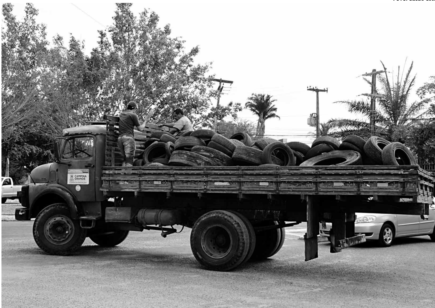
Caminhões da Secretaria de Serviços Urbanos já recolheram mais de três mil pneus inservíveis de terrenos baldios na cidade

Bombeiros e Exército estão visitando as residências e orientando sobre a prevenção ao mosquito