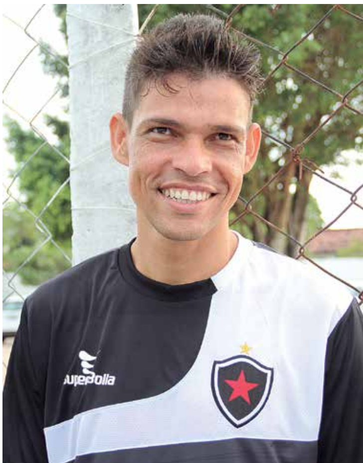
Meia marcou três dos sete gols do Belo na última partida amistosa

"Deixa isso para Neymar, Messi e Cristiano Ronaldo, que são craques mundiais. Sou apenas mais um que chega para ajudar os companheiros a brigar por vitórias e títulos. Temos um caminho difícil pela frente e vamos nos unir para fazer do Botafogo um time vence-