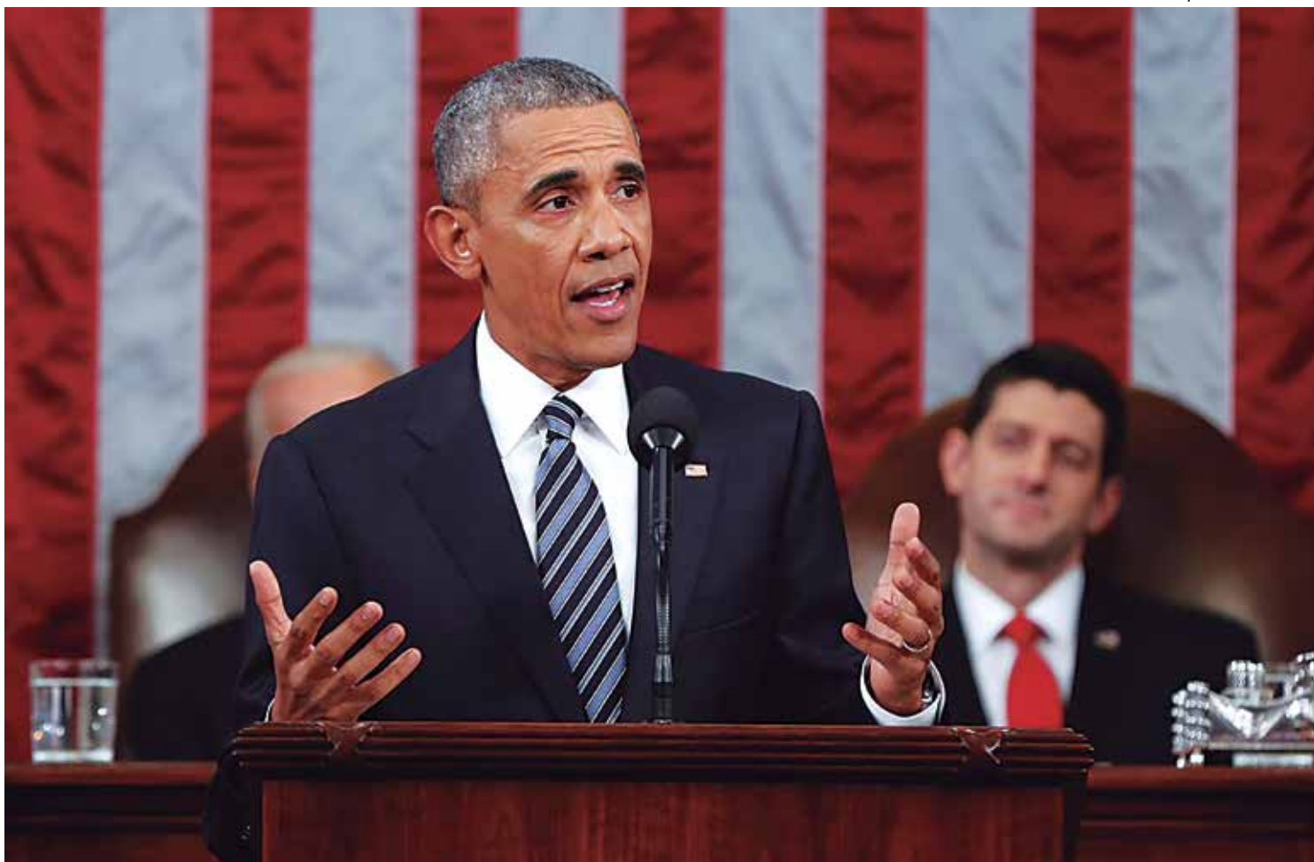
O presidente Barack Obama exortou o Congresso norte-americano a autorizar o uso de forças militares contra o Estado Islâmico

Na visão dele, no entanto, isso não quer dizer que os Estados Unidos devam ser radicais